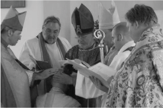
Köpenhamn: "Mottag den Helige Ande för biskopens ämbete och arbete i Guds kyrka."