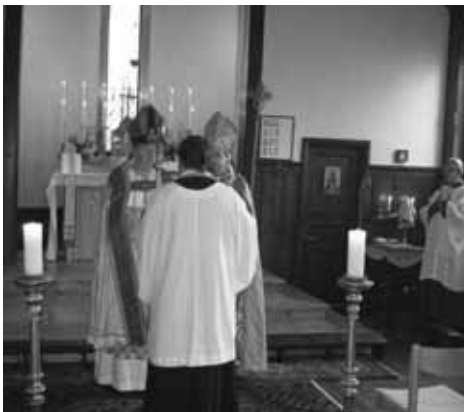
Mikaelidagen: åminnelse av kyrkans konsekration