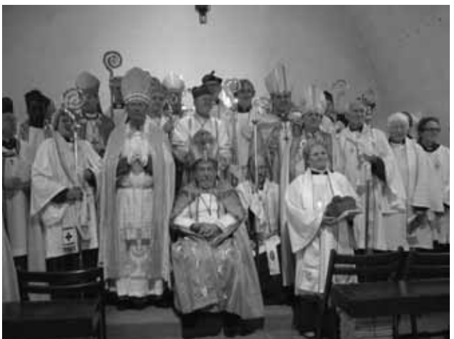
Amsterdam: alla som medverkade i koret.