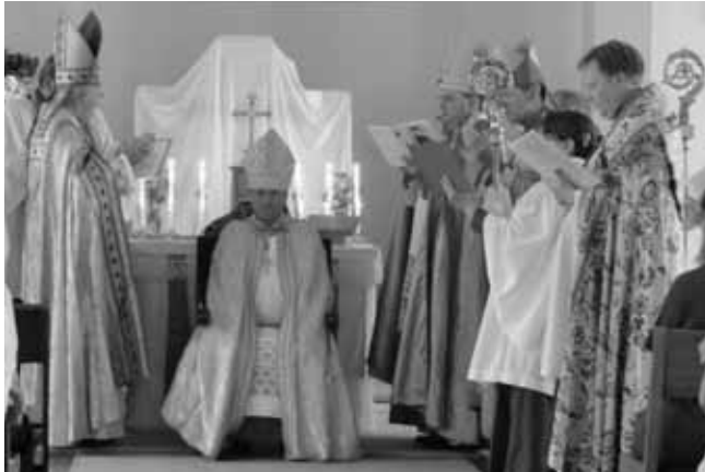
Köpenhamn: Biskop Uffe - tronad.