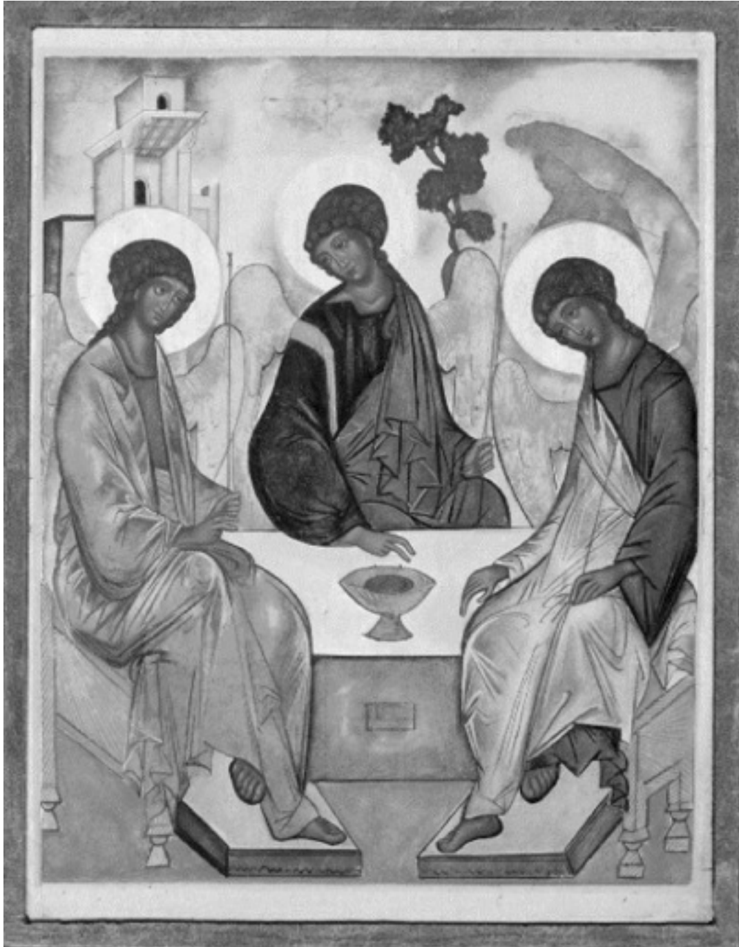
Andrej Rubljov – Den gammaltestamentliga Treenigheten (1425–1427). Tretjakovgalleriet, Moskva.

LIBERALKATOLSK KYRKOTIDNING NR 2 2015 ÅRG 47